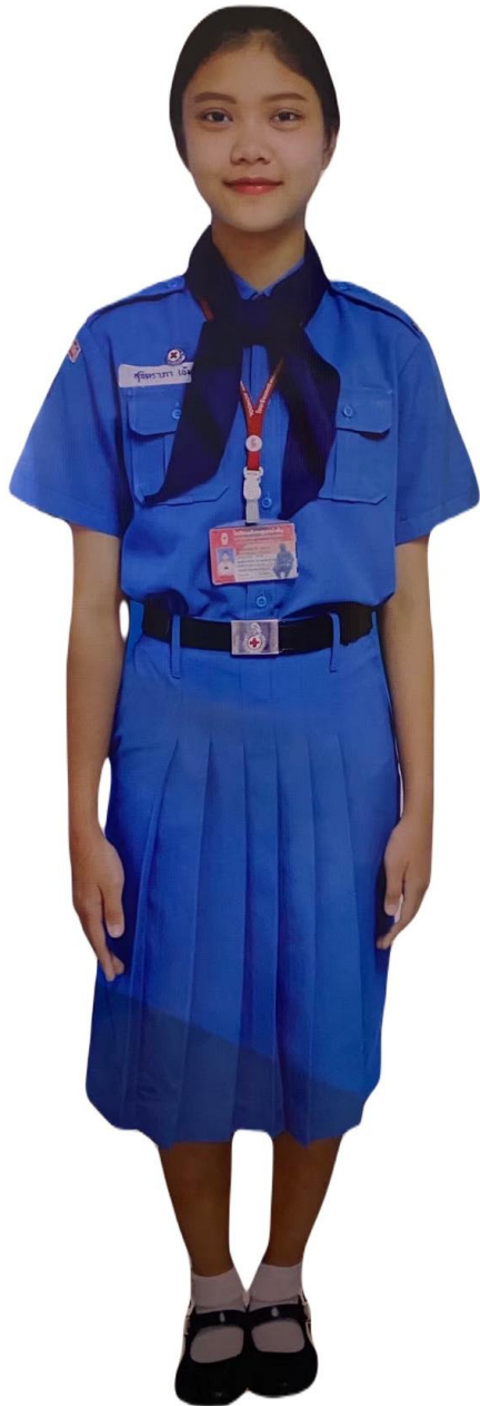
ม.1/2,4,6,8,10 : ชุดยุวกาชาด