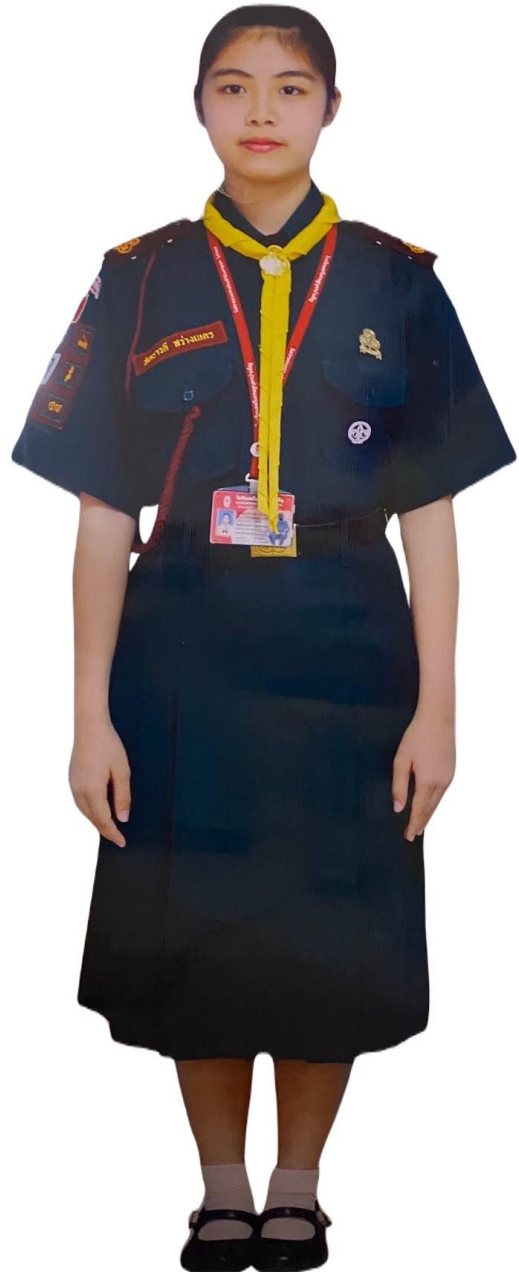
ม.1/1,3,5,7,9,11 : เนตรนารี

กลุ่มบริหารงานบุคคล โรงเรียนสตรีศรีนครปฐมบำเพ็ญ